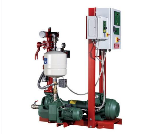
• 1KDN 65-200/190 MD EN

在消防领域，DAB 提供了基于定制规格定制产品的可能性，由于多种类型附件的空间要求，出于整体尺寸上的考虑，也提供适当的支持服务，以确保符合当前的消防规则。